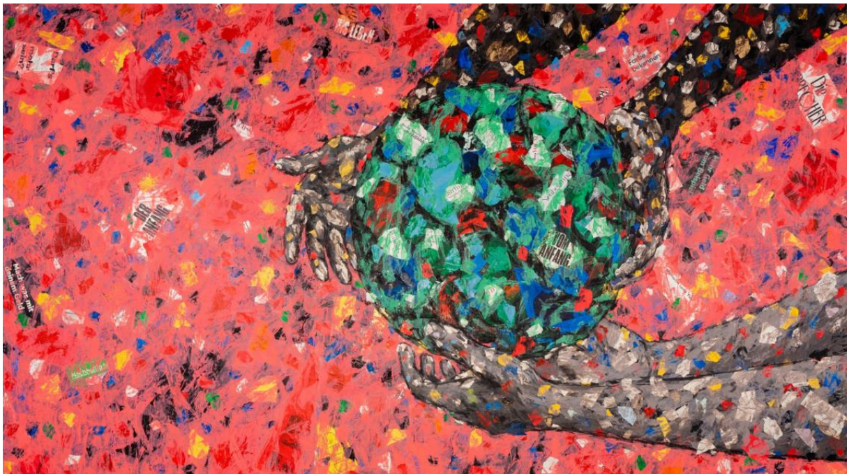
Misereor Hungertuch 2023/24

Fasten heisst nicht einfach hungern. Wir tasten uns mit Farbe und Pinsel an das «Fastenthema» heran. Es gibt auch etwas zu essen. Was wohl?